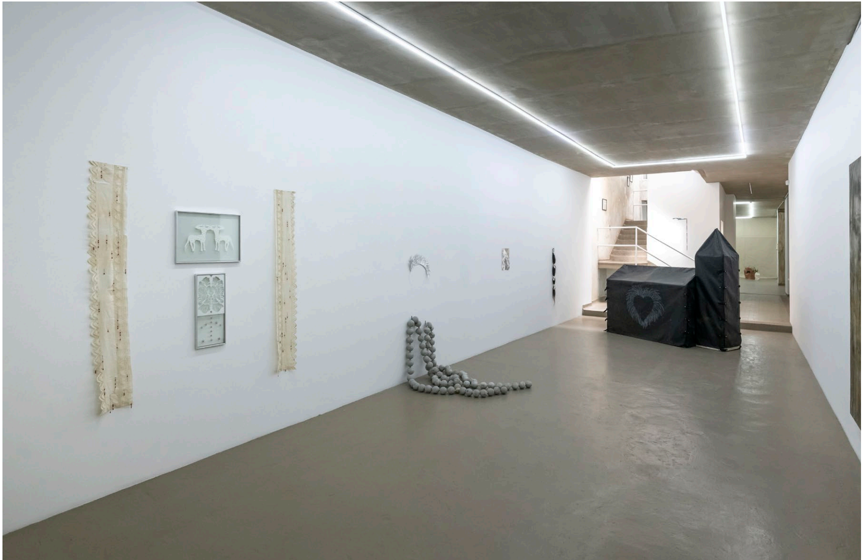
Vista de exposición, Galería Sketch, Bogotá, 2022