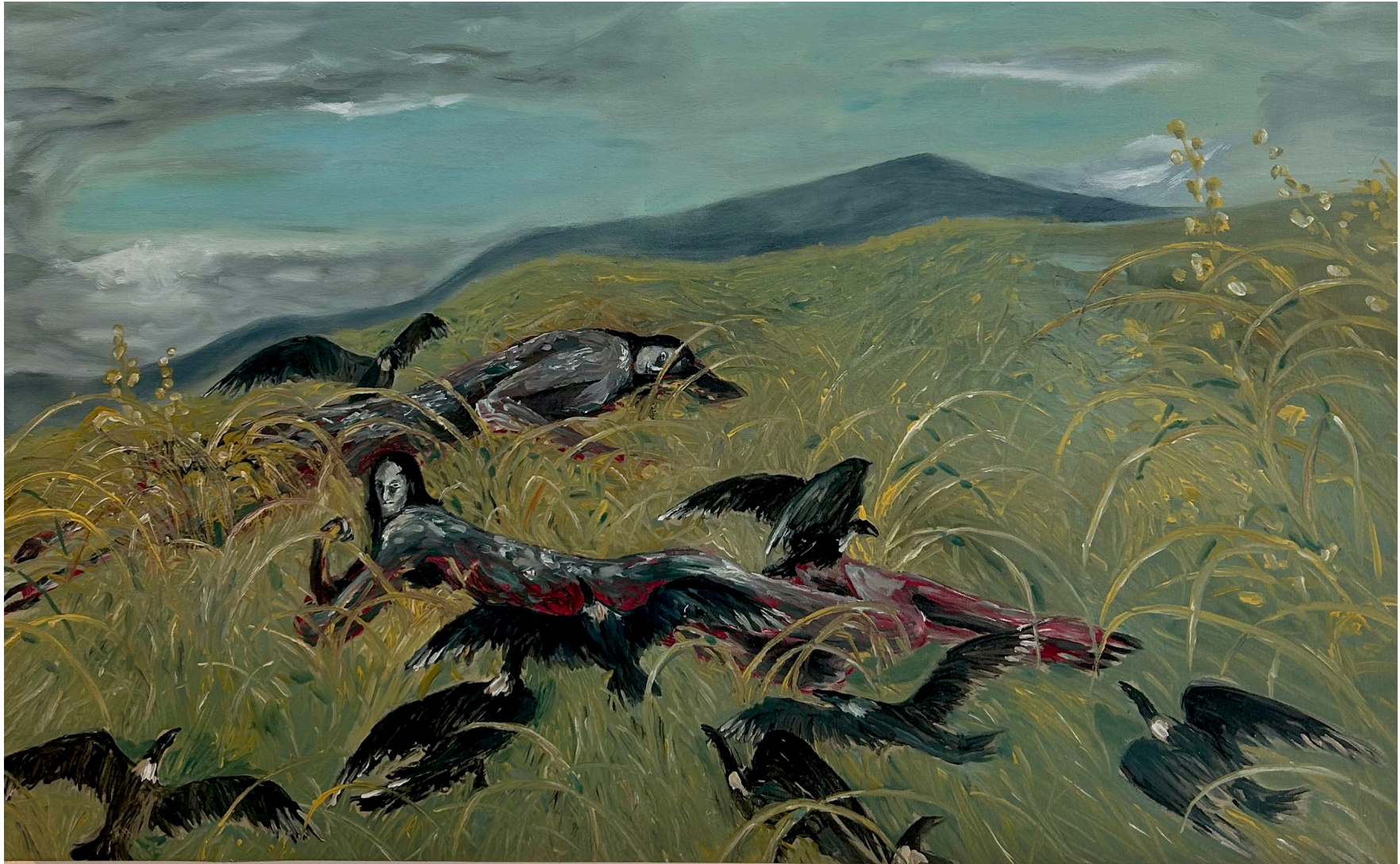
Festín de aves negras , 2024 Óleo sobre lienzo 61 x 101 cm Pieza única