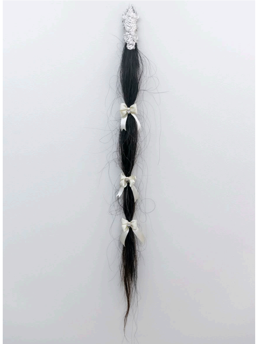
Centauros , 2021 Díptico: Repujado sobre metal, crin de caballo con detalles metálicos Dimensiones variables Piezas únicas