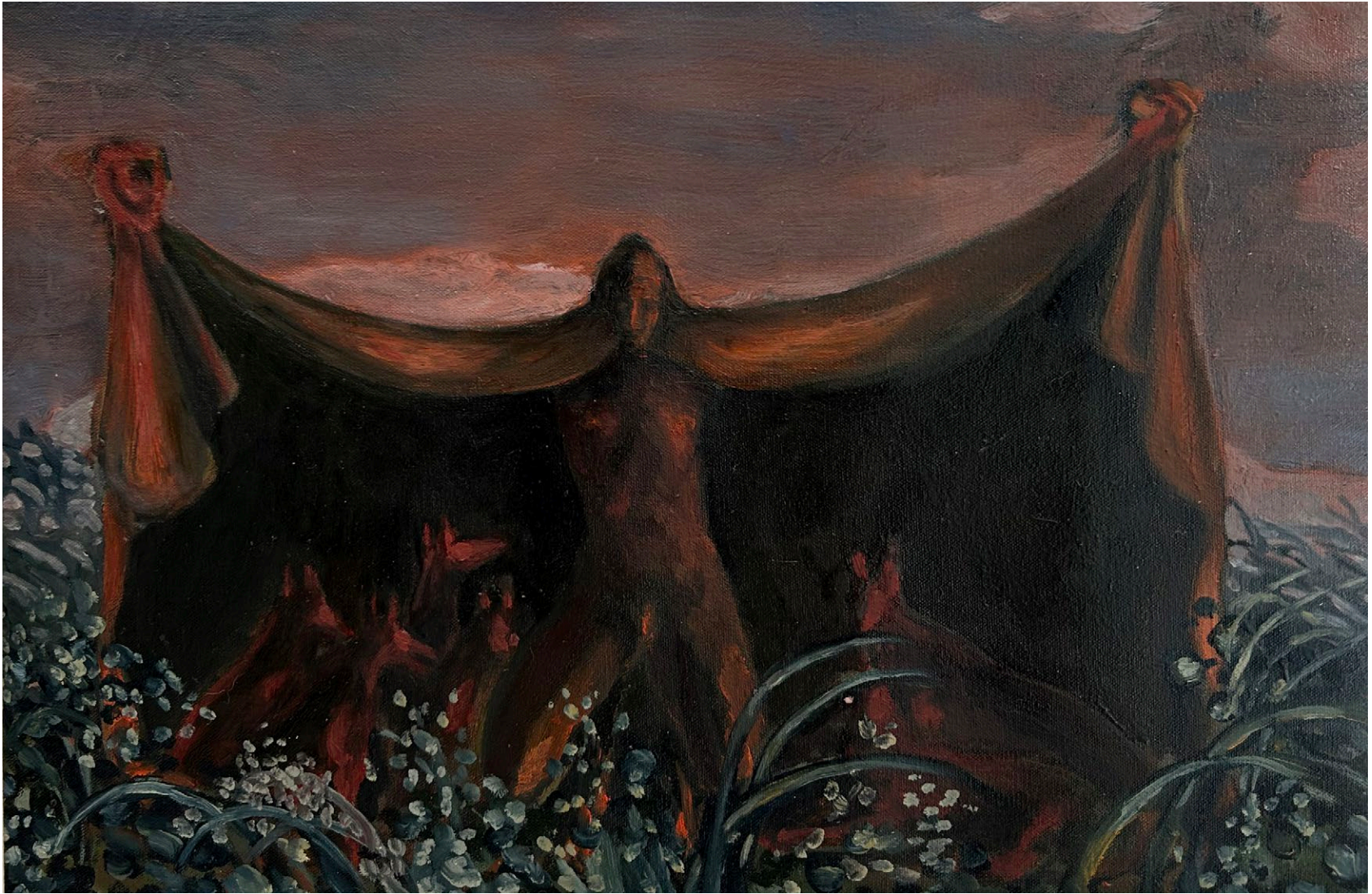
Sin título , 2024 Óleo sobre lienzo 31 x 50 cm Pieza única