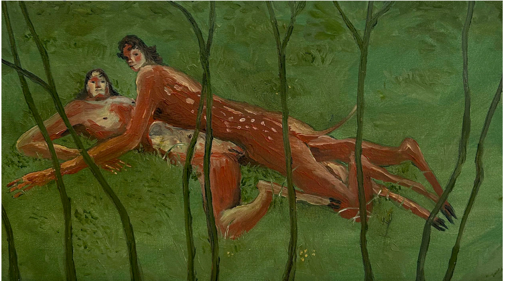
Venados , 2024 Óleo sobre lienzo 32 x 58 cm Pieza única