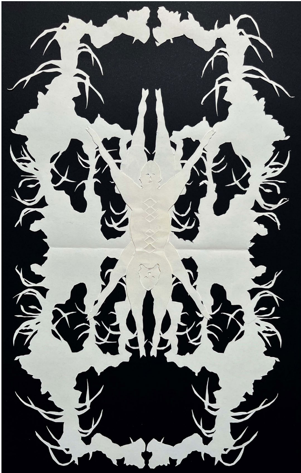
Animales Surcidos , 2023 Recorte de papel 50 x 35 cm Pieza única