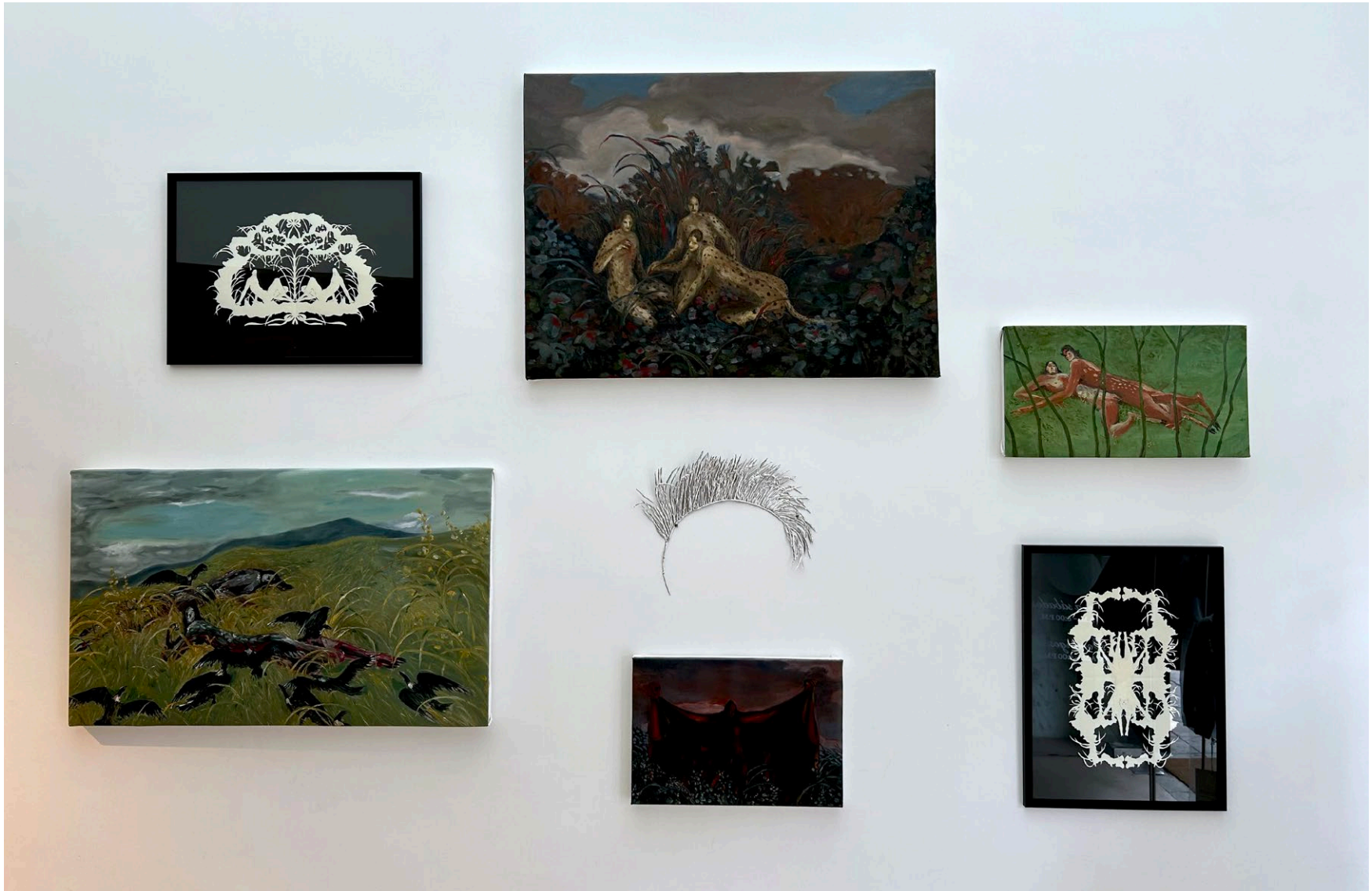
Vista de exposición, Paisaje, Bogotá, 2024