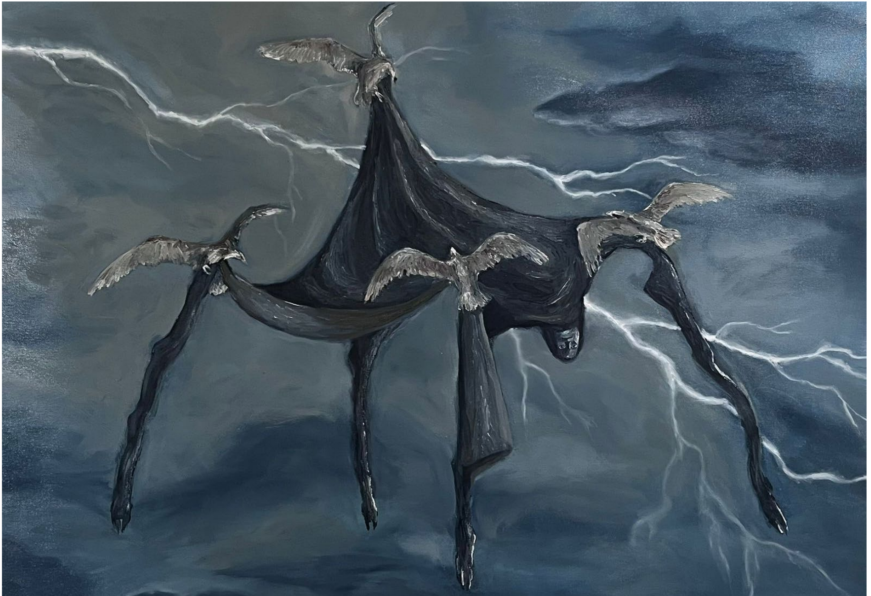
Ofrendar el cuero , 2024 Óleo sobre lienzo 72 x 96 cm Pieza única