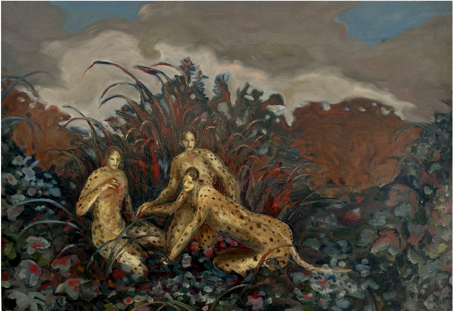
Herida de hermandad , 2024 Óleo sobre lienzo 76 x 100 cm Pieza única