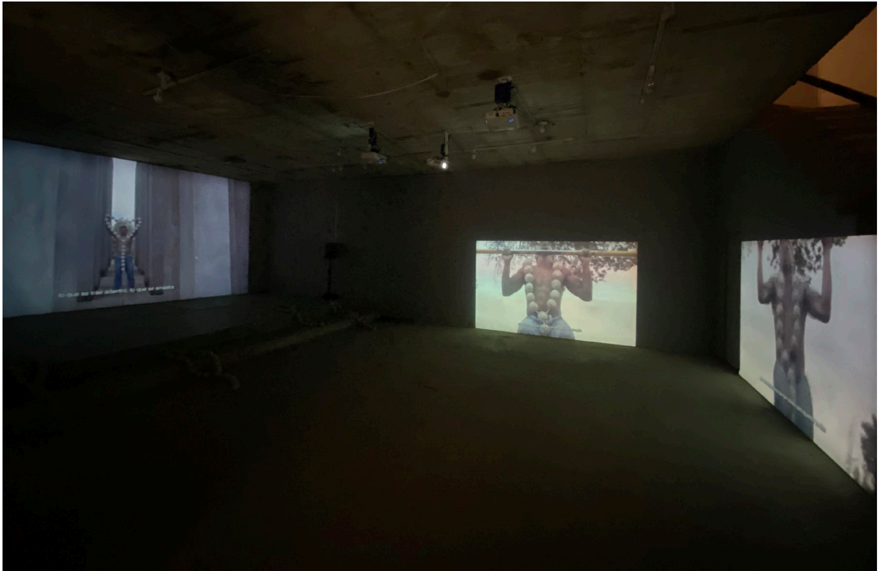
Vista de exposición, Espacio Odeón, Bogotá, 2023