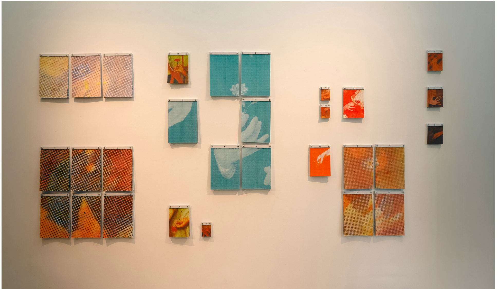
Vista de exposición