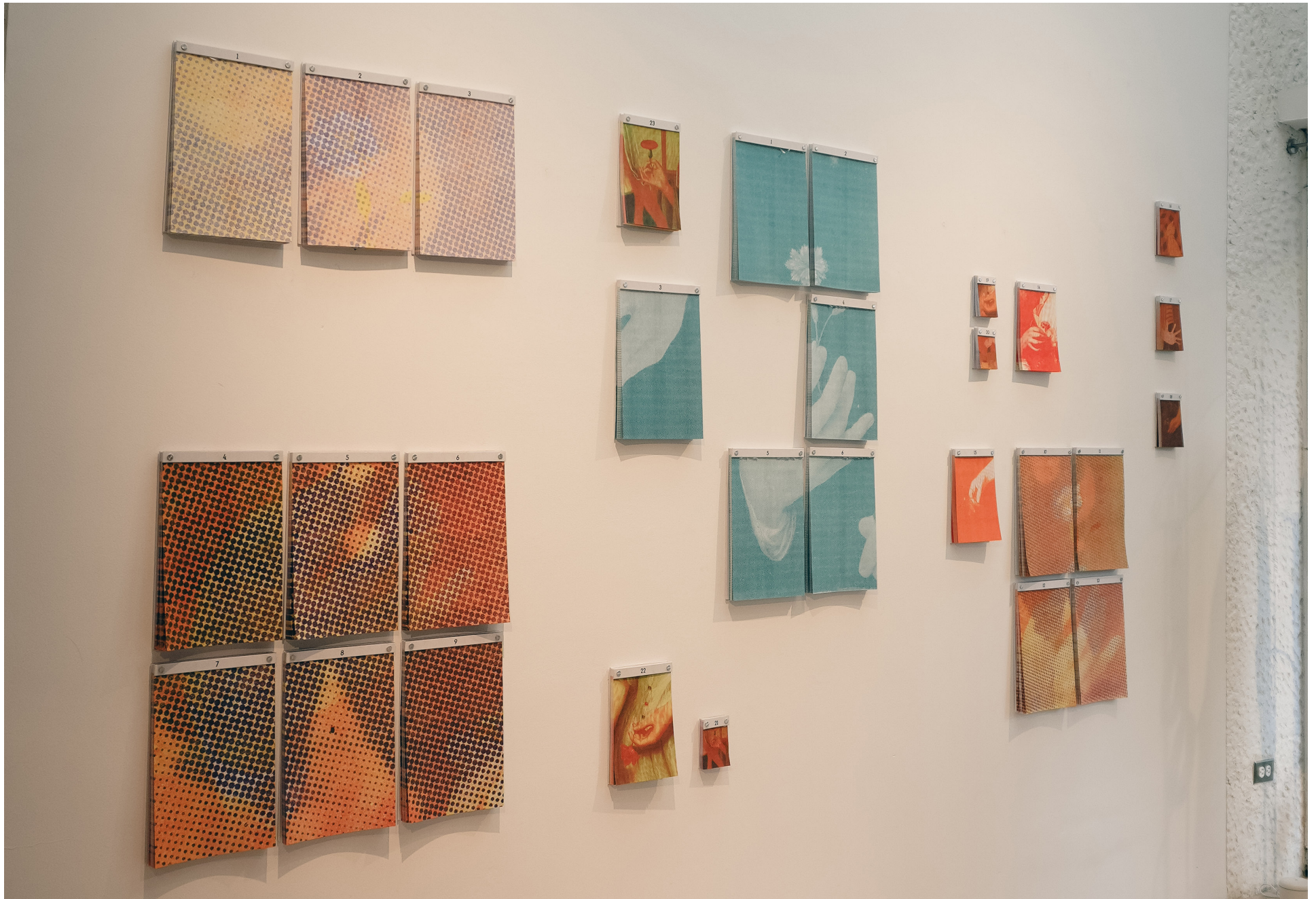
Vista de exposición