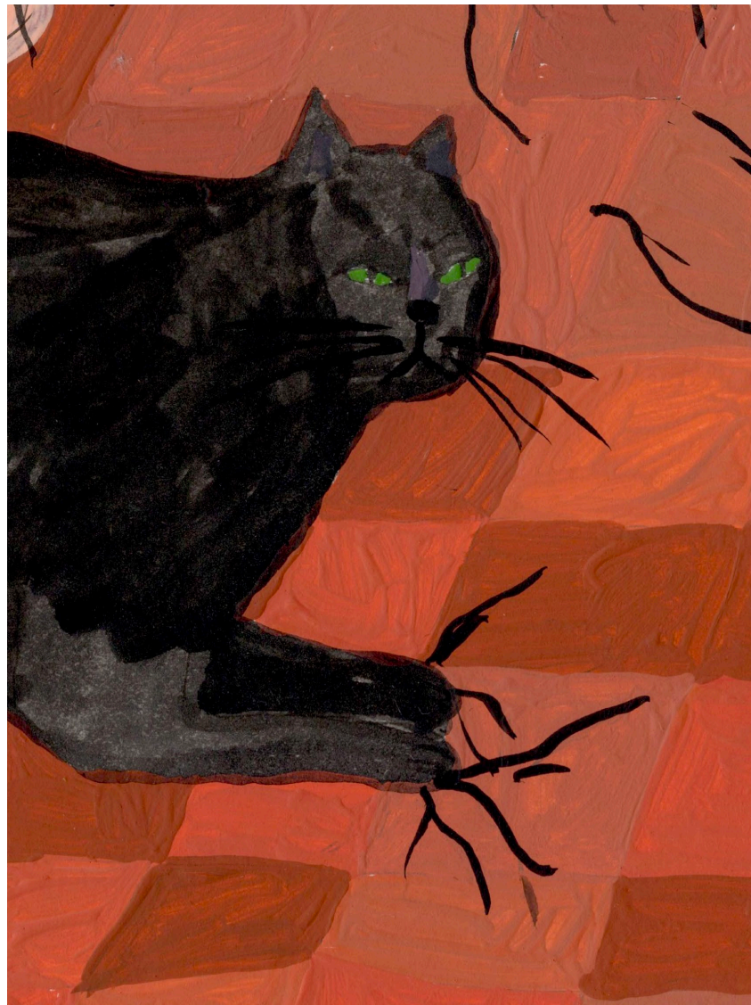
Julia. Ella también tiene el pelo negro, como el mío, 2025 Gouache sobre papel 26,5 × 22 cm Pieza única