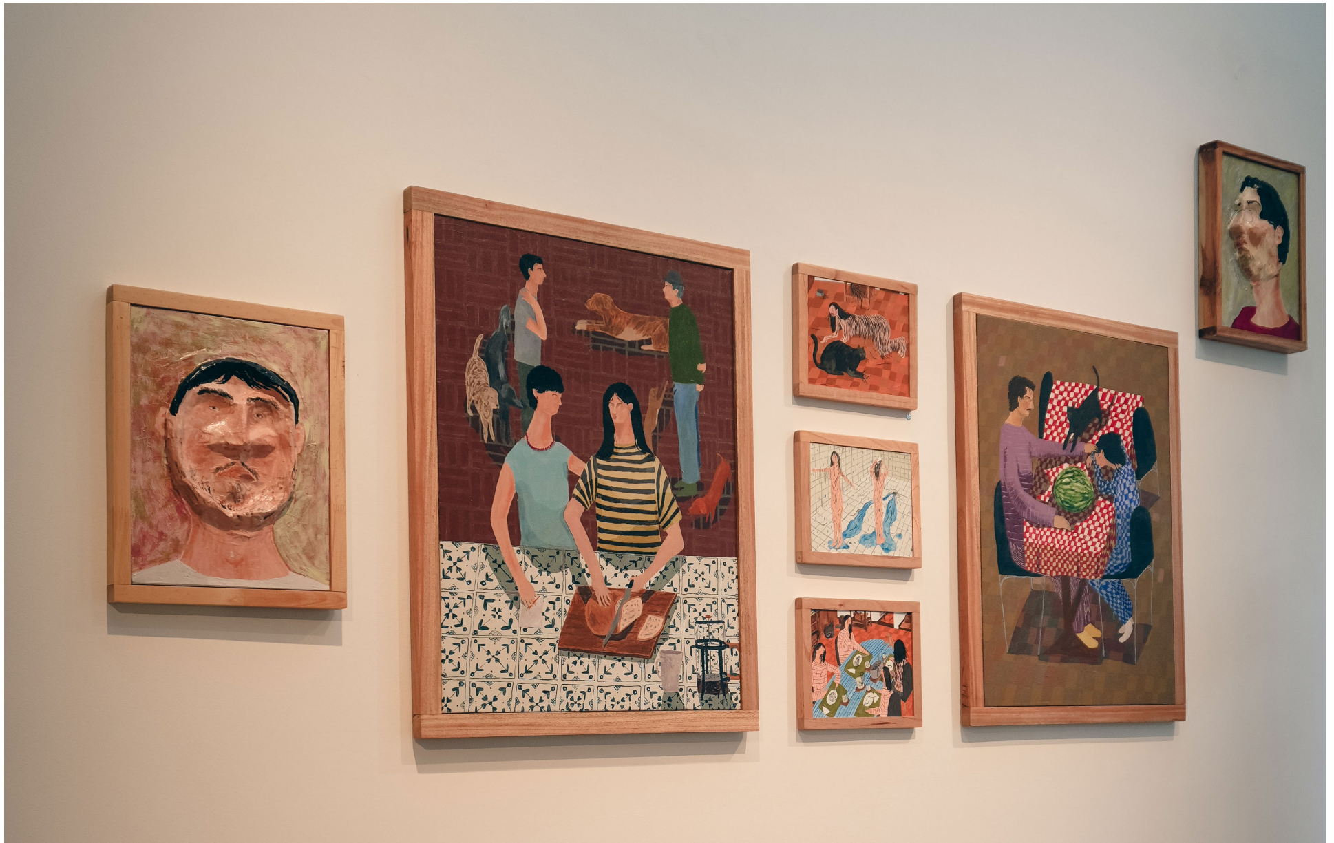
Vista de exposición