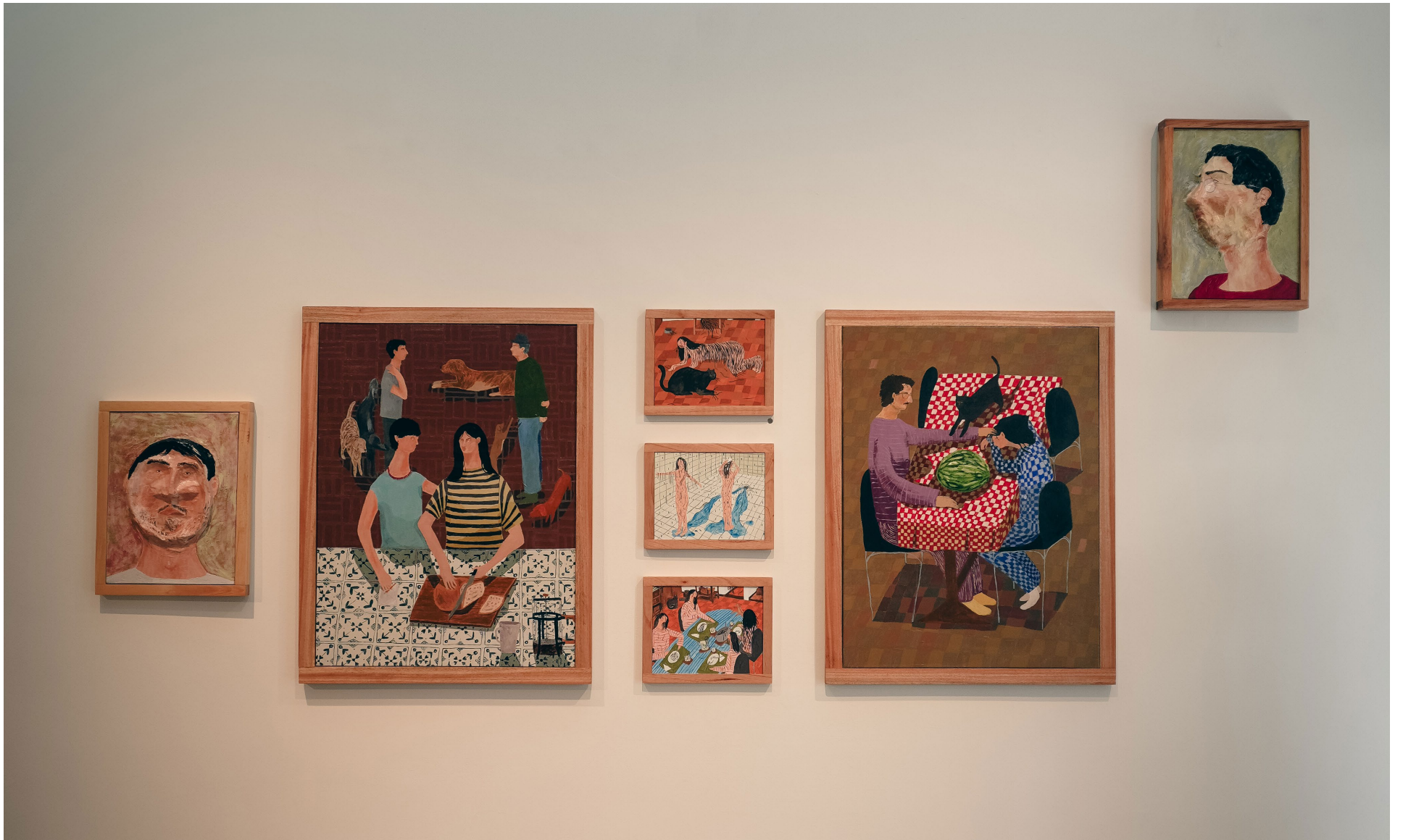
Vista de exposición