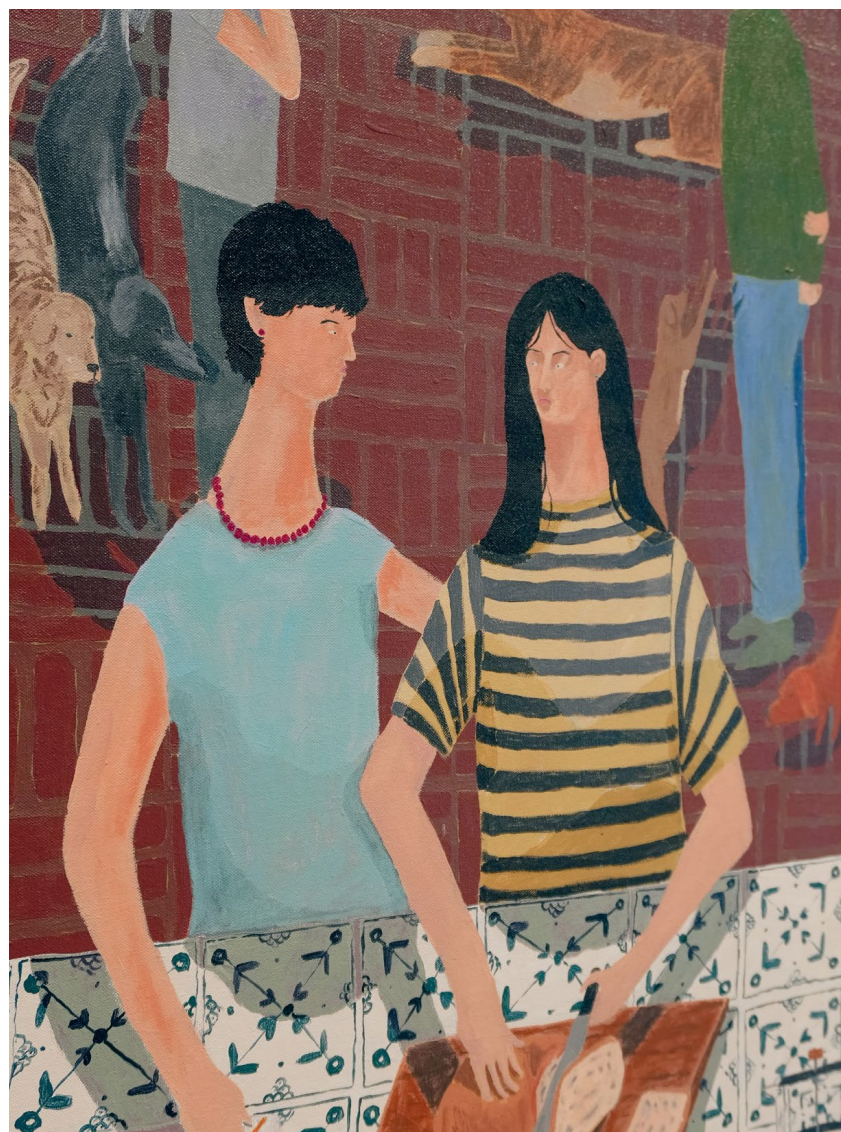
Un secreto por la mañana, 2026