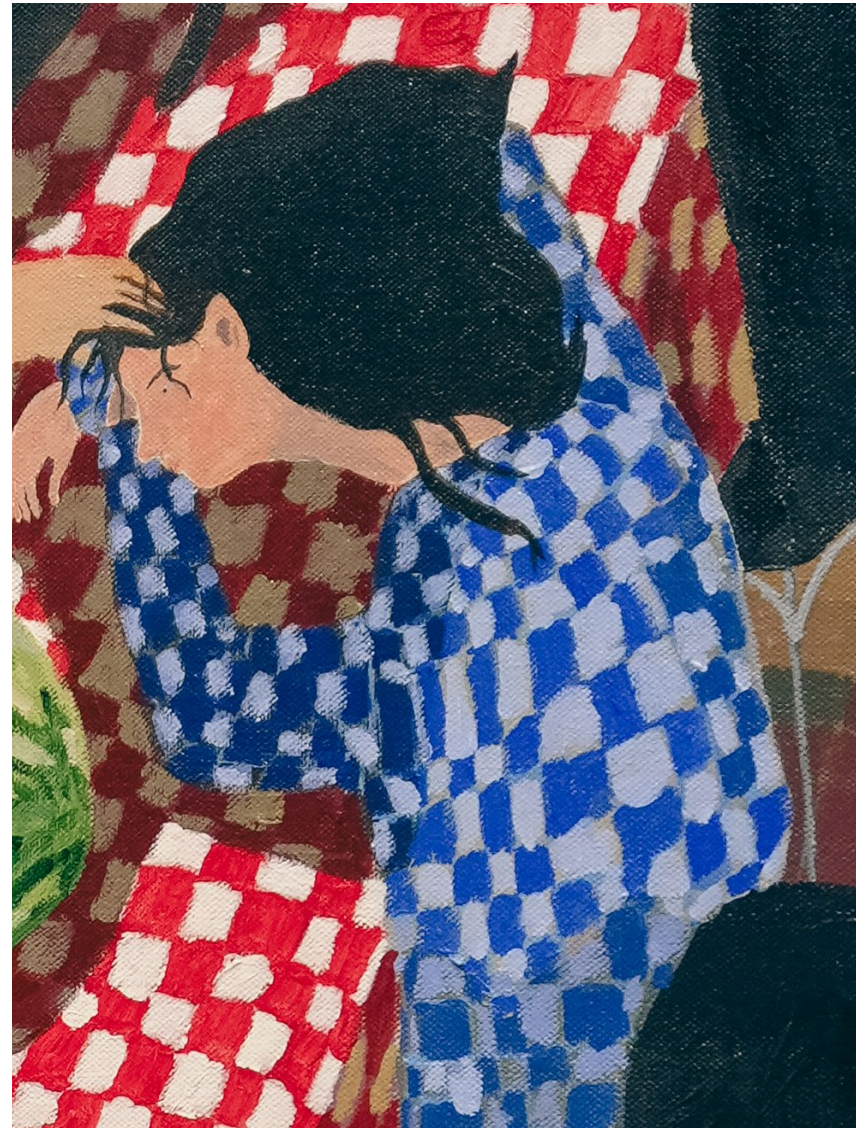
En Navidad me regalaste una sandía, 2026