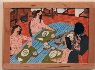
Vista de exposición