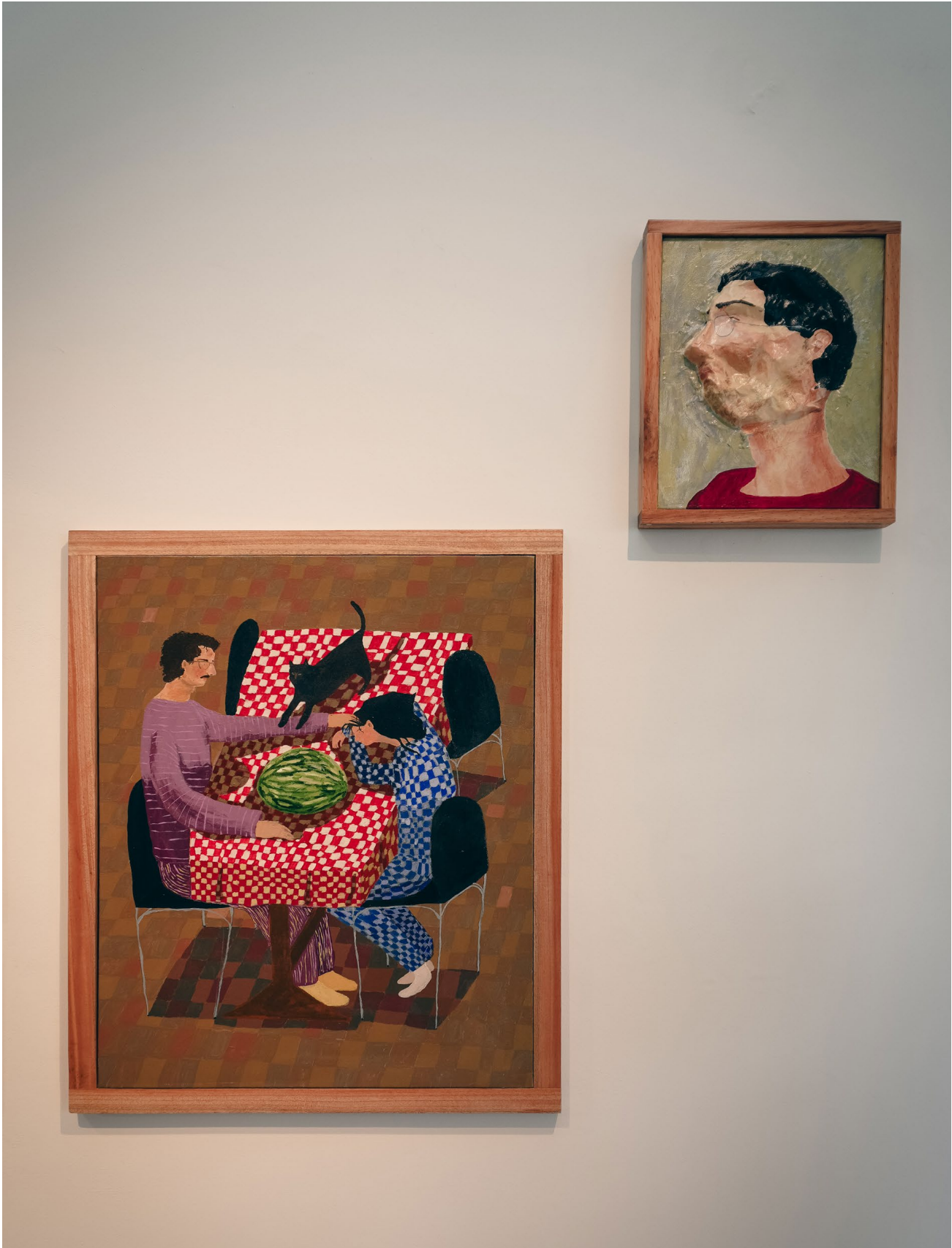
Vista de exposición