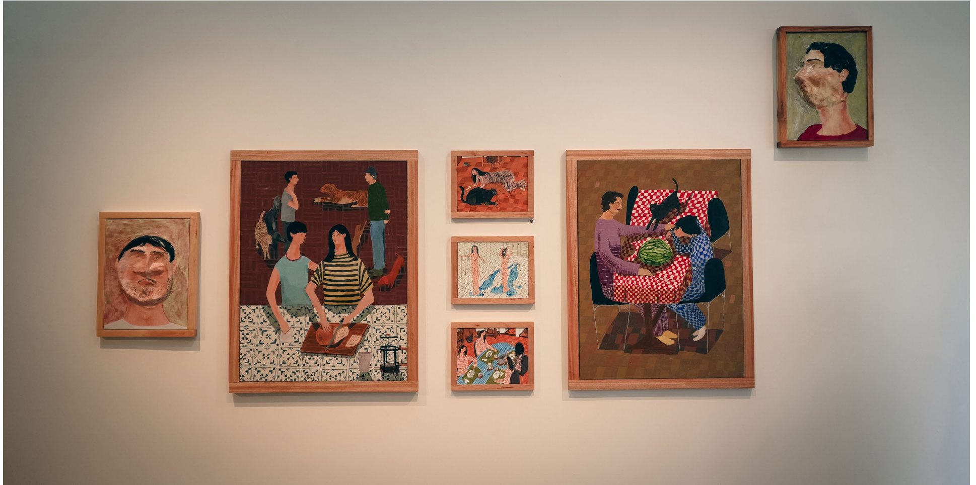
Vista de exposición