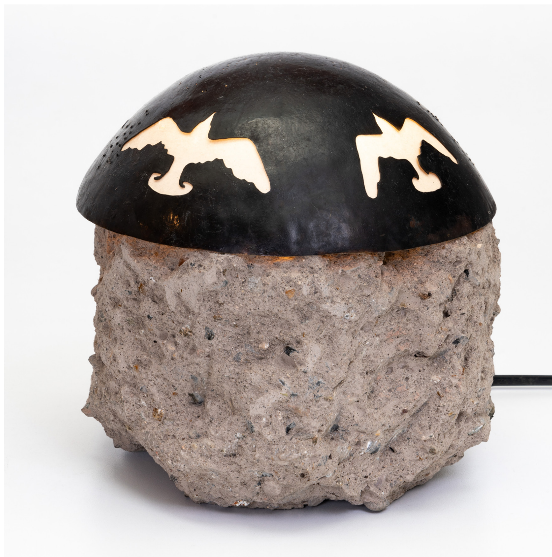
Movimiento de un ave Concreto, metal y bombillo Ø 16 x 18 de altura Pieza única