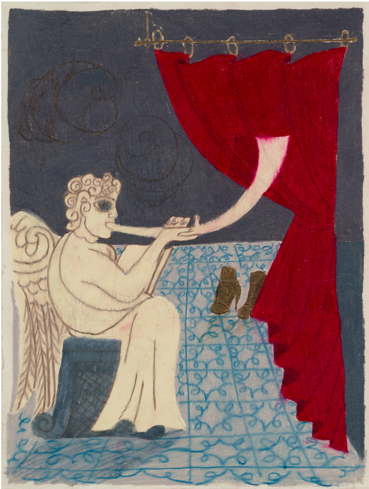
Tacones y un ángel Lápices de color sobre papel 25 x 17 cm Pieza única