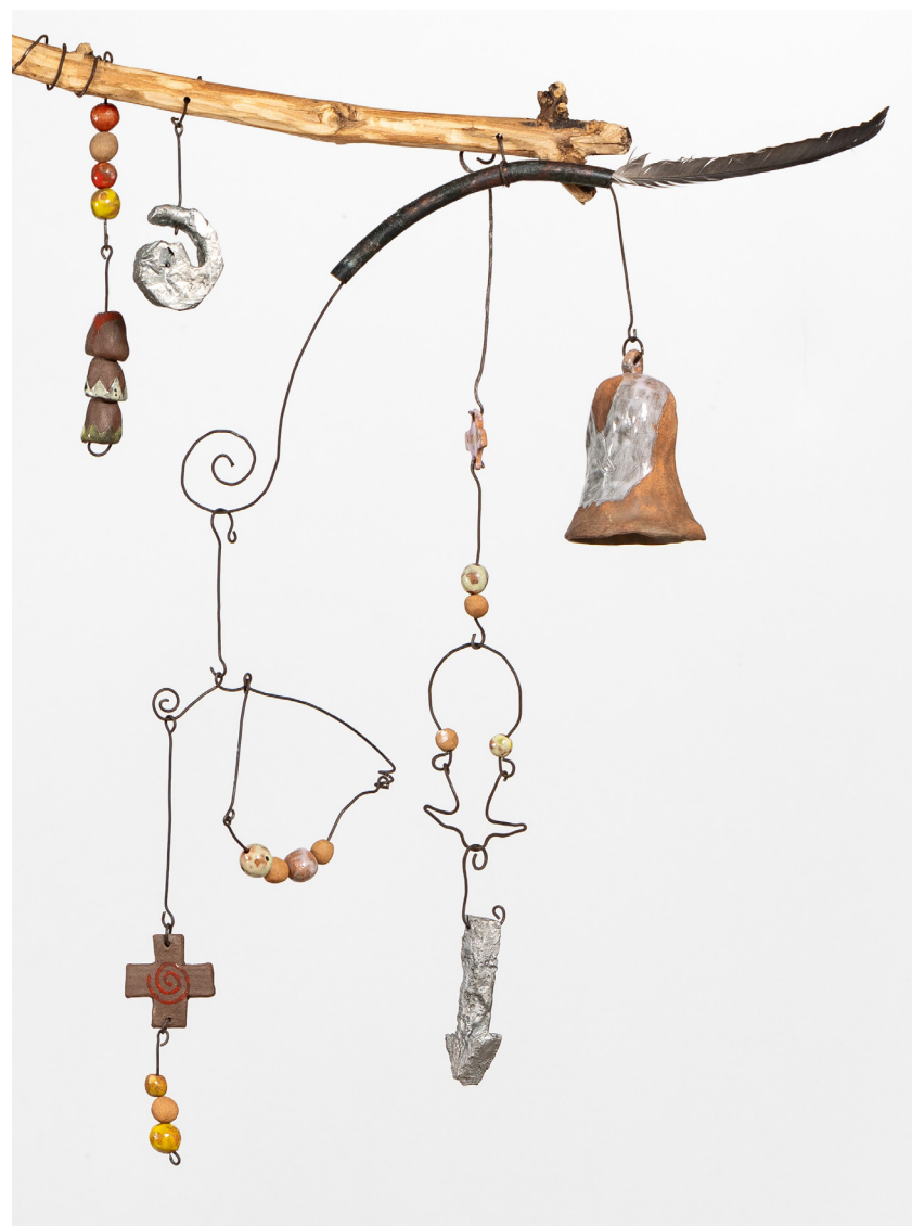
Como el peso del cuerpo ergido se balancean las articulaciones