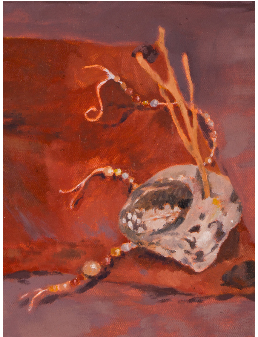
Tela sobre cuerpo (Bodegón)