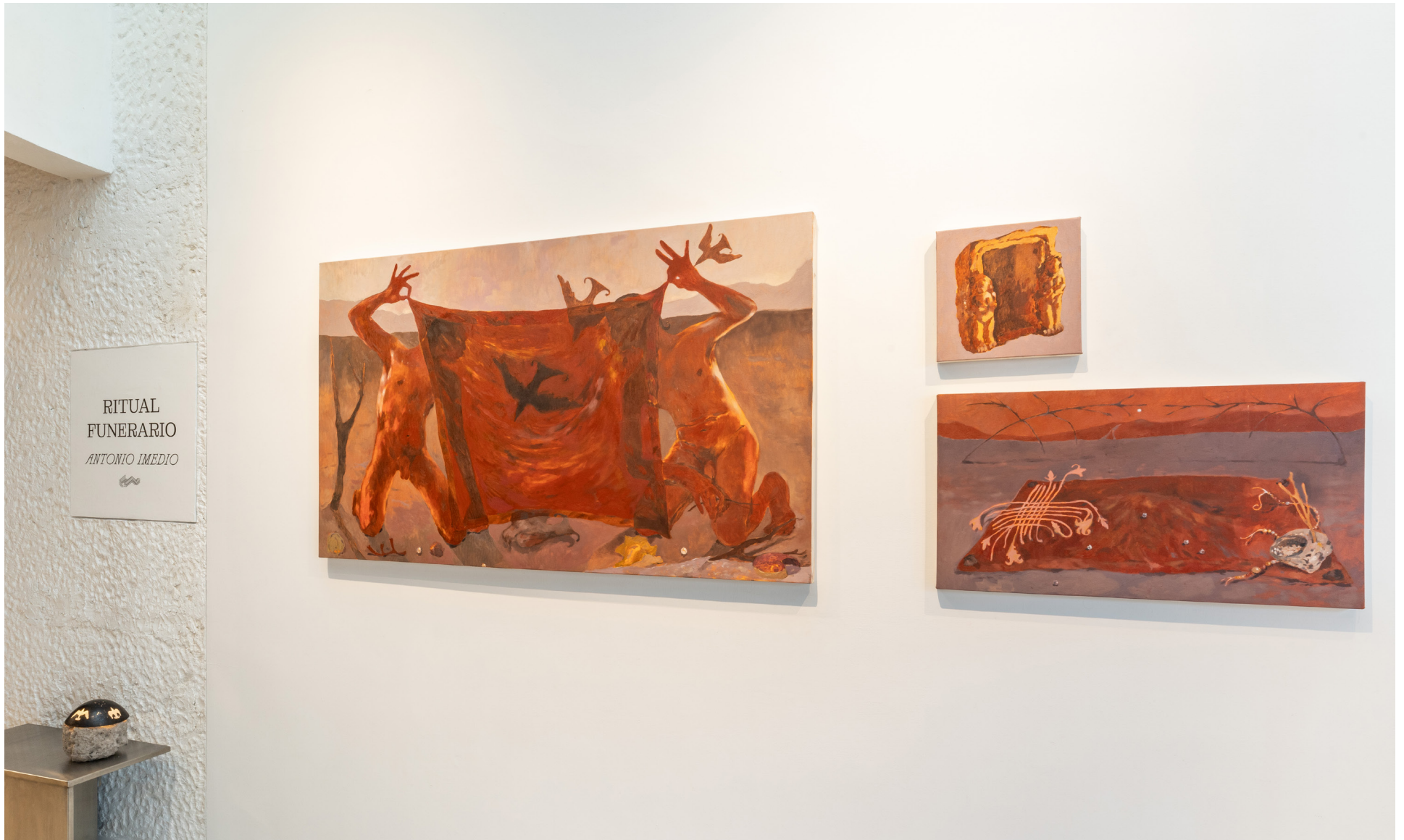
Vista de exposición