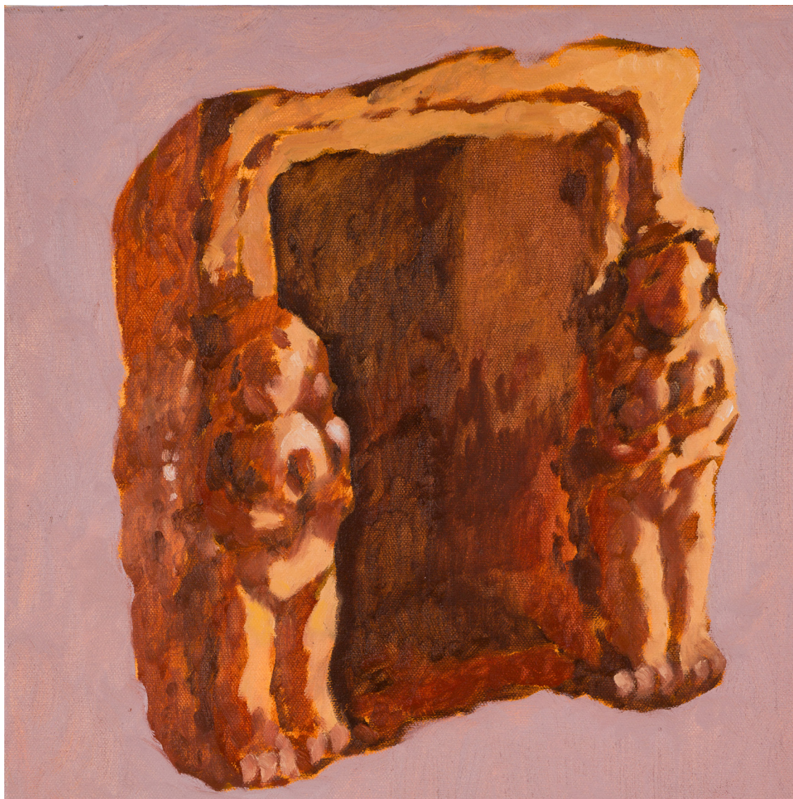
Relieve fenicio 30 x 30 cm Óleo sobre tela Pieza única