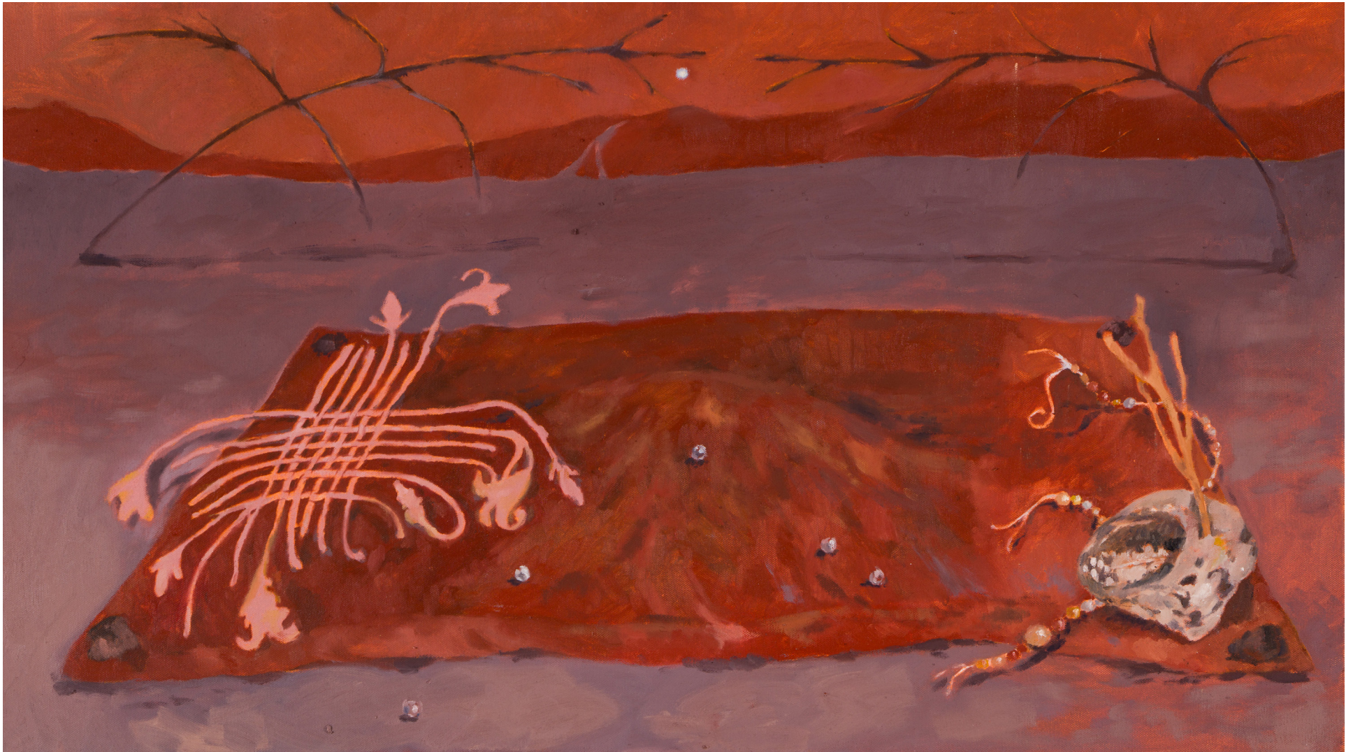
Tela sobre cuerpo (Bodegón) 45 x 80 cm Óleo sobre tela Pieza única