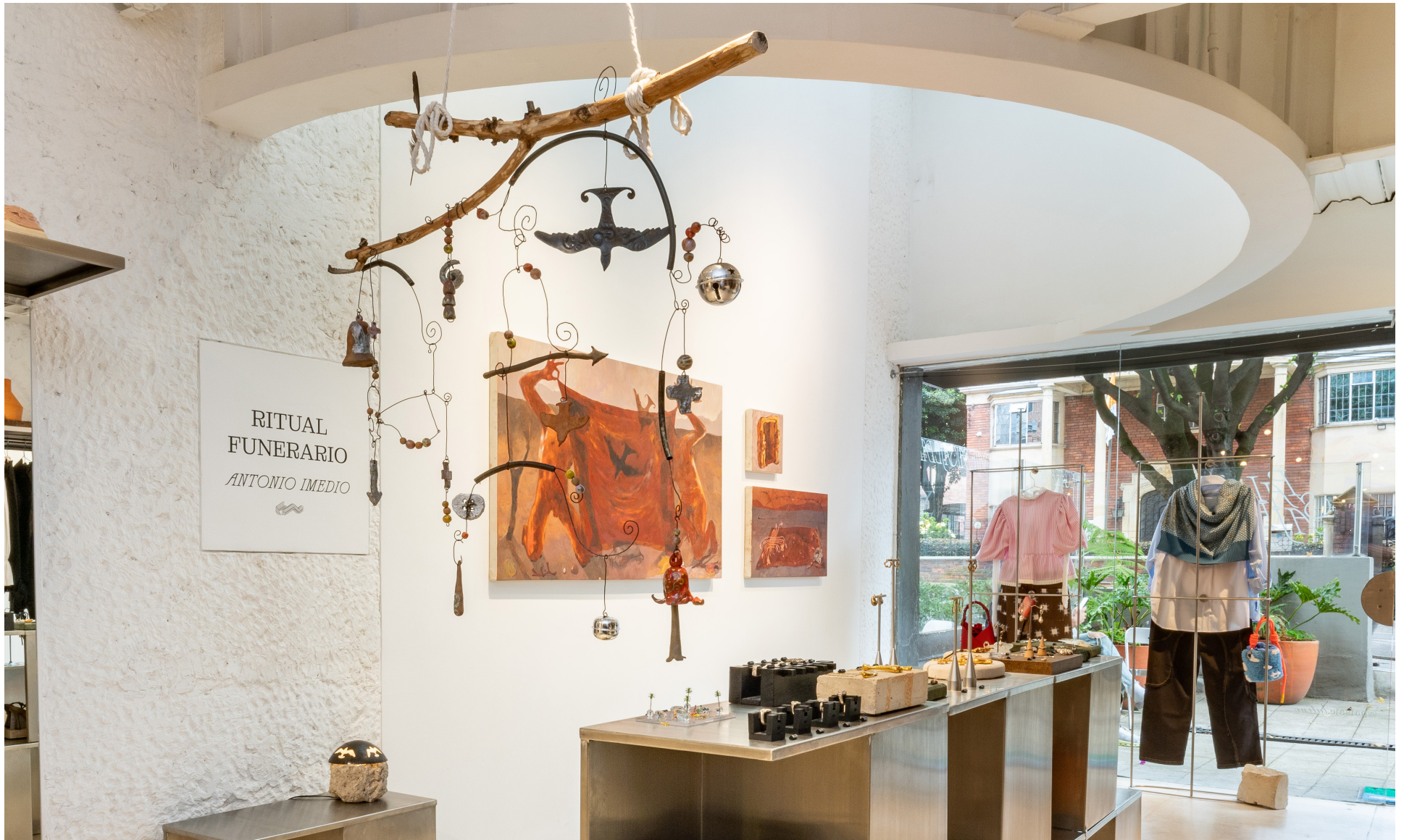
Vista de exposición