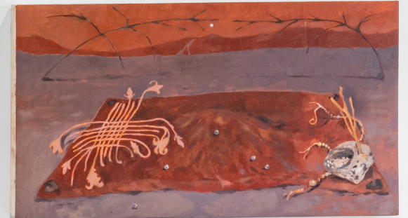
Vista de exposición