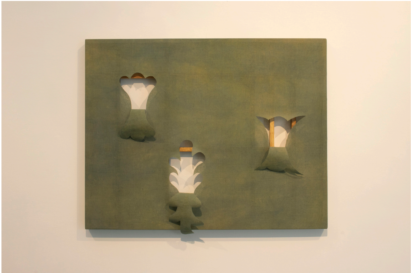
Flores II, 2025 Estructura de madera y tela con recortes 55 x 70 cm