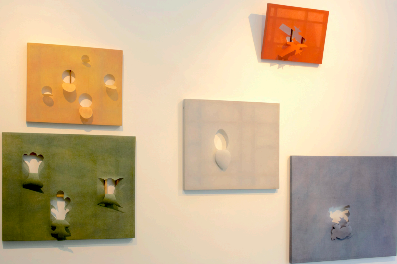
Vista de exposición