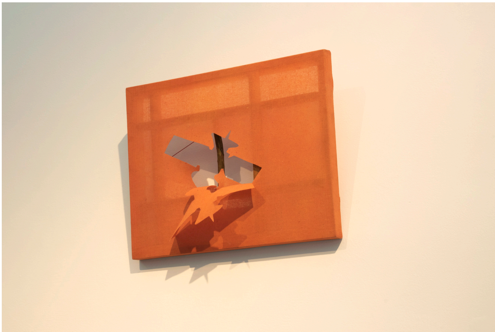
Satélite, 2025 Estructura de madera y tela con recortes 32 x 41 cm