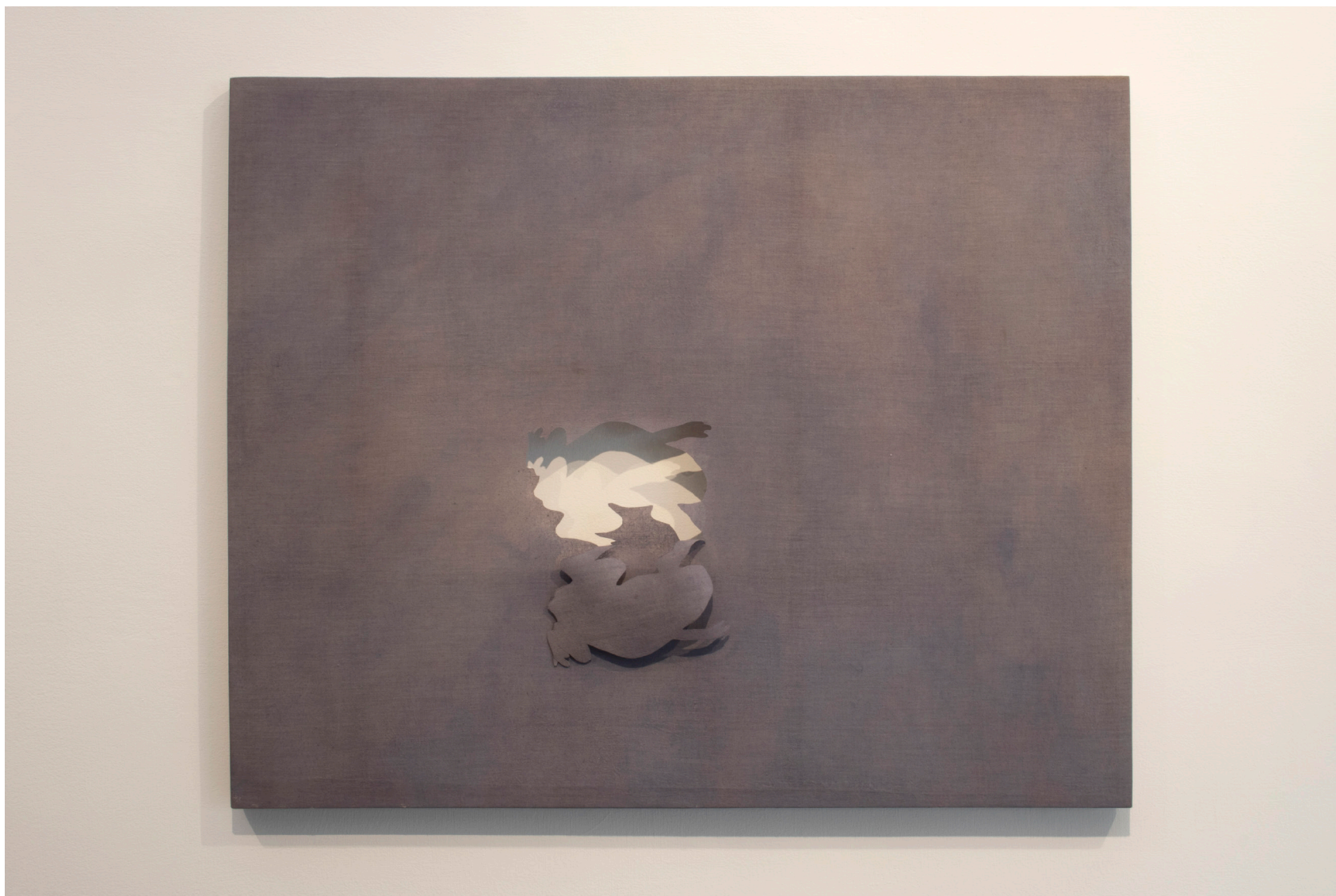
Rana, 2025 Estructura de madera y tela con recortes 65 x 80 cm