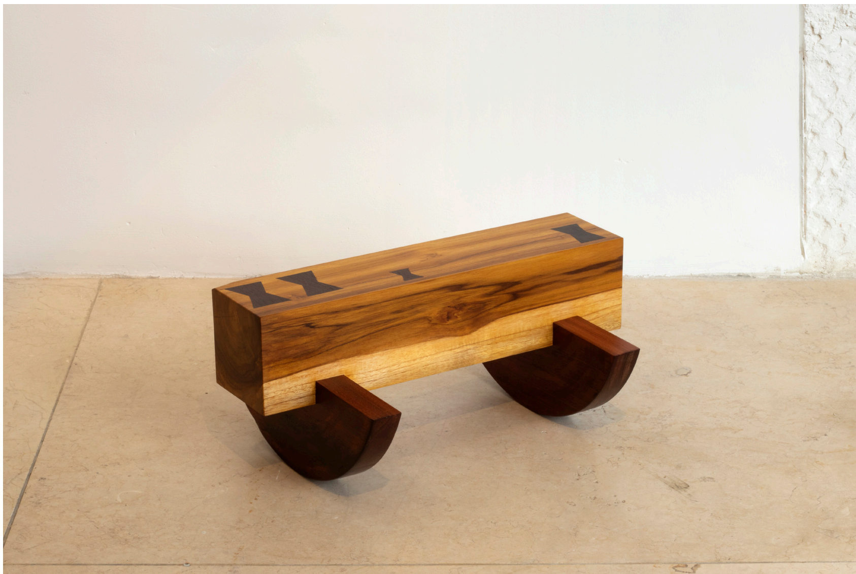
Mecedor, 2025 Teca, nogal y abarco 49 x 36 x 22 cm