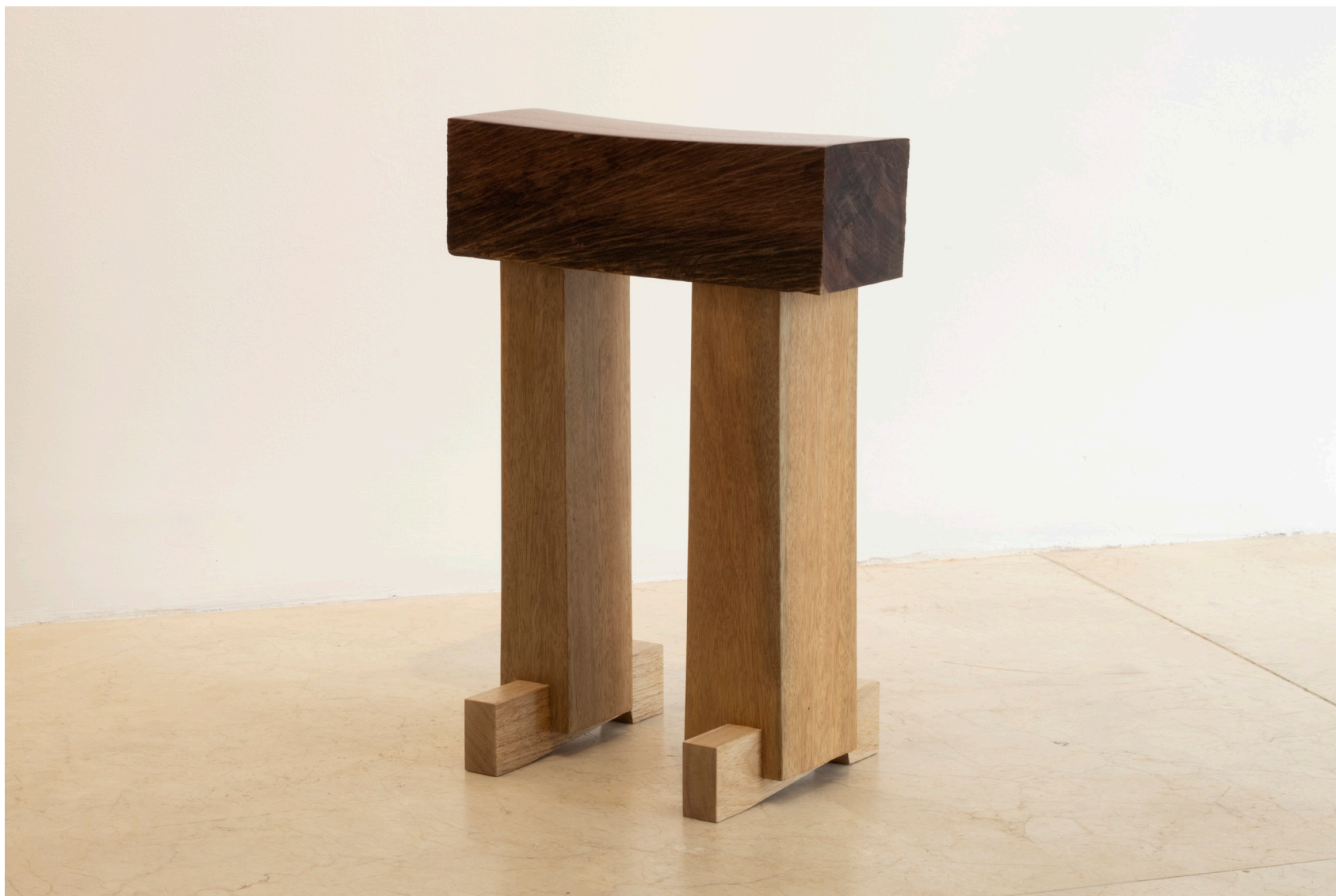
Zapatos I, 2025 Amarillo, urapán y nazareno 31 x 20 x 43 cm