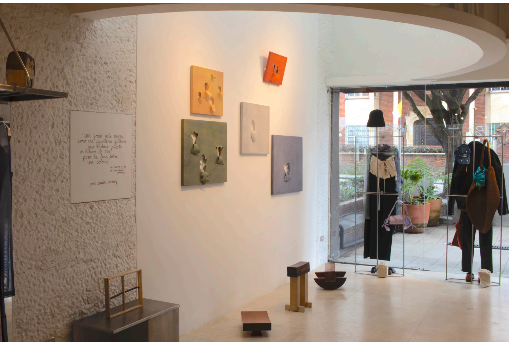
Vista de exposición