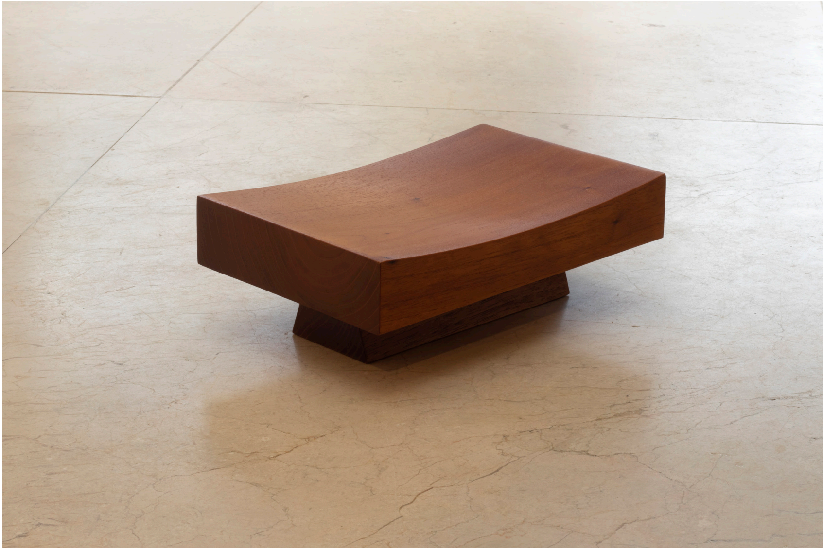
Almohada, 2025 Cedro 36 x 23 x 12 cm 700 000 COP