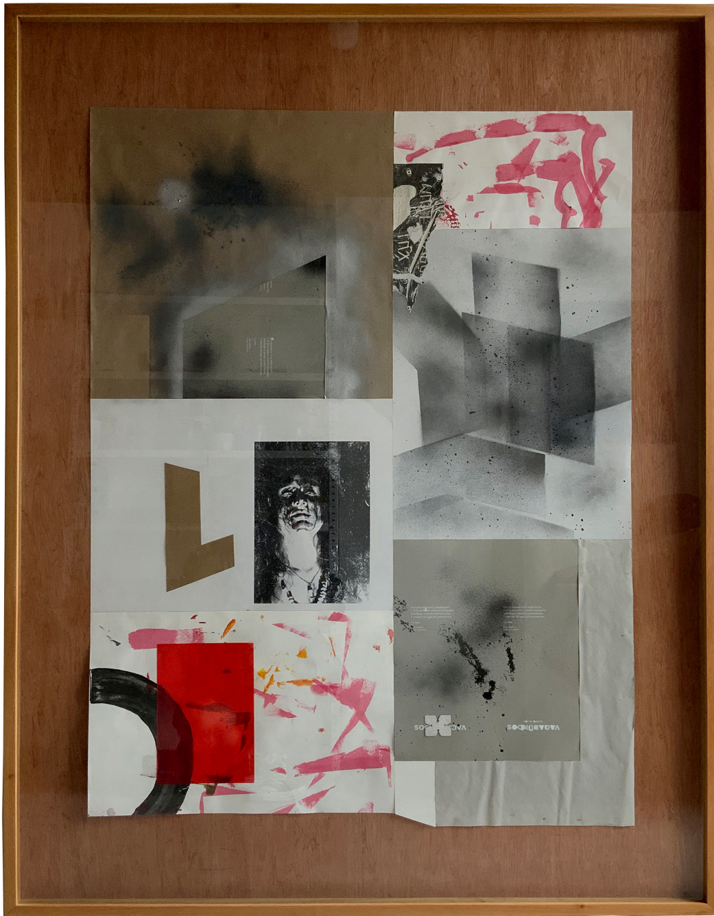
Composición, partes I, 2022 142 x 102 cm Collage, Serigrafía, Técnica Mixta 2022