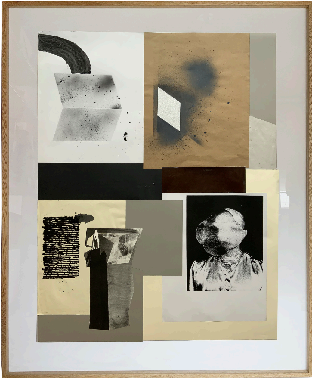
Composición, partes II, 2022 142 x 102 cm Collage, Serigrafía, Técnica Mixta 2022